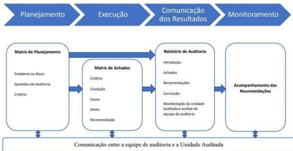
Figura 1 – Fluxo dos elementos do Relatório de Auditoria